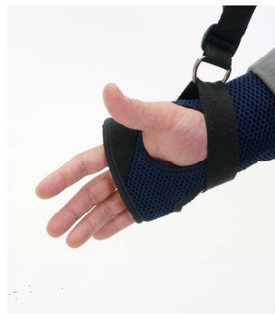
例1: グローブタイプ