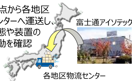
各地区物流センター