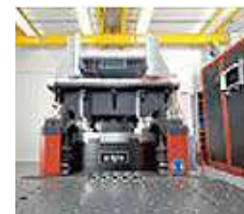
EN(European Norm)規格(欧州規格)準拠